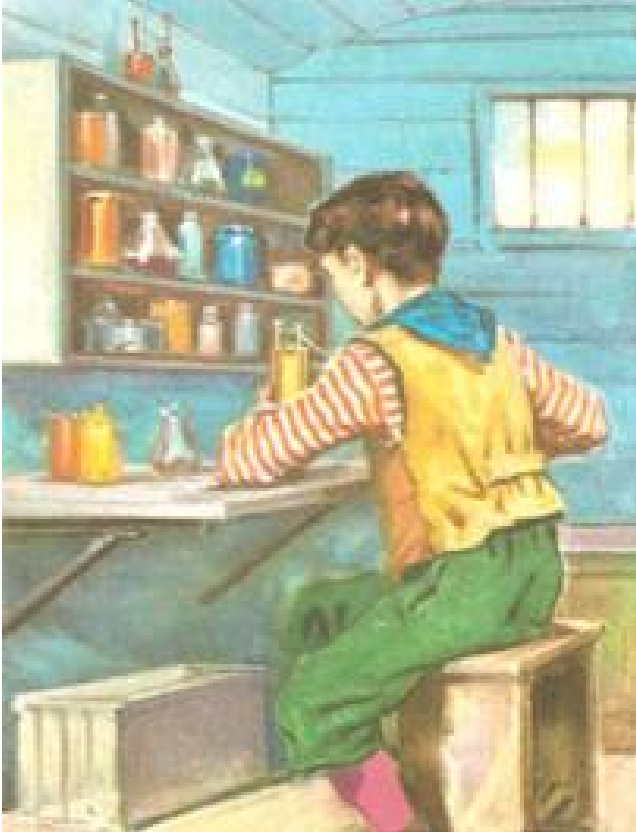
Edison's train laboratory.

థామస్ ఎడిసన్ ఒక అమెరికన్ ఆవిష్కర్త, బహుశా అన్ని కాలాలలో గొప్పవాడు, అతని పేరు మీద 1,300 పేటెంట్లు ఉన్నాయి. అతని మొదటి విజయవంతమైన ఆవిష్కరణ, మెరుగైన స్టాక్-టికెట్ (1869), టెలిగ్రాఫిక్ ఉపకరణం తయారీదారు కావడానికి అతనికి మూలధనాన్ని సంపాదించిపెట్టింది. న్యూజెర్సీలోని మెన్లో పార్క్లో కొత్త "ఆవిష్కరణ కర్మాగారం" (మొదటి భారీ-